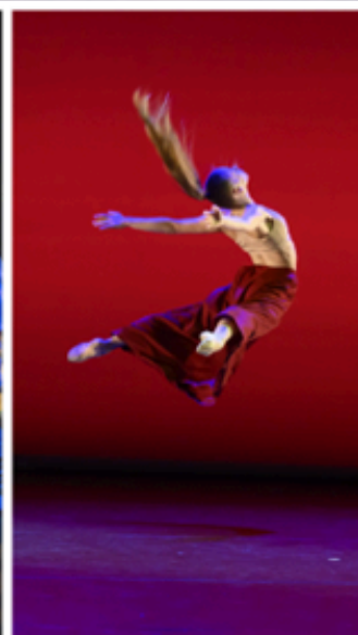
Dans l'ordre d'apparition de gauche à droite : Divente, Les Grandes Noces, Bleu de Chine, 4 mains dansent Ravel, Le Carnaval des Animaux, La Huella